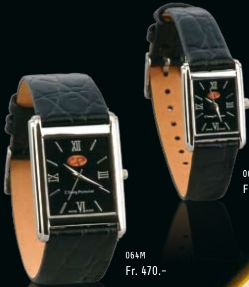
064M Fr. 470.-